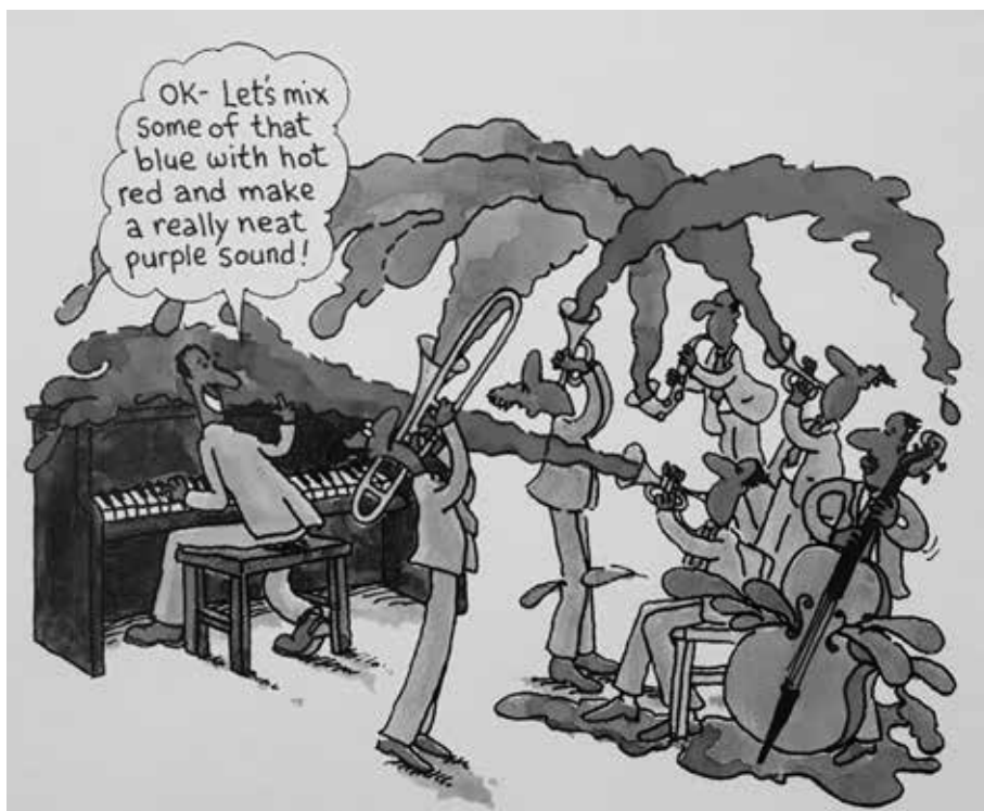
Illustration av Mike Venezia.

Som representant för sin ras var det självklart att många kompositioner fick titlar där olika nyanser av svart och brunt förekommer. Den mest kända är naturligtvis Black , Brown And Beige . Lika känd är Black And Tan Fantasy , men vi hittar också titlar som Black Beauty , Black Butterfly och Black Swan . När det gäller brun färg hittar man titlar som Brown Betty , Brown Penny , Brown Suede och Brown-Skin Gal . Inte att förglömma är den vackra Sepia Panorama , som Duke