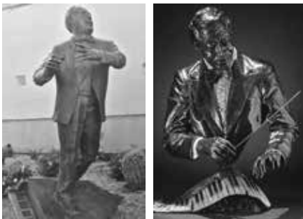
Staty i Las Sendas, Arizona, och en statyett föreställande Ellington med taktpinne.