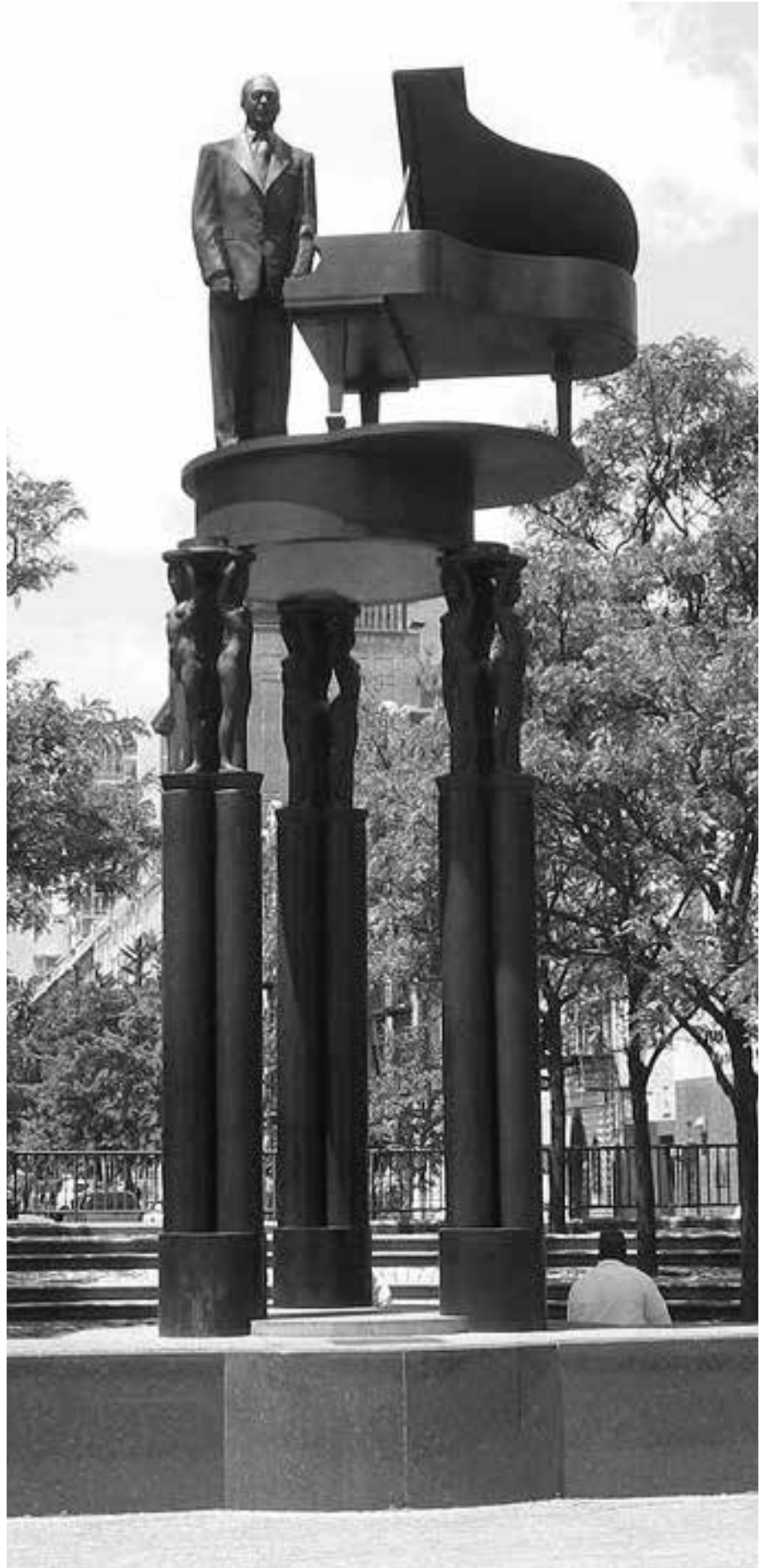
Vid Duke Ellington Circle, Central Park, New York.