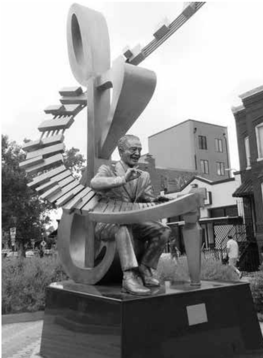
Statyn utanför Howard Theatre i Washington.