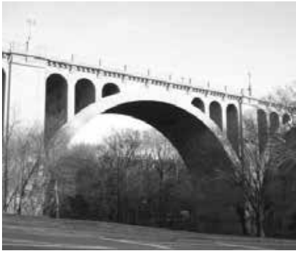
Duke Ellington Memorial Bridge i stadsdelen Georgetown, Washington.