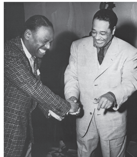
Hines and Ellington agreed. (A later occasion).