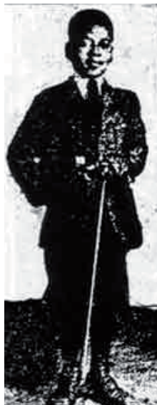
Nance age 15