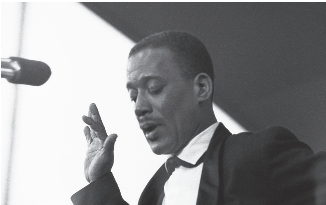
Ray Nance at Gröna Lund, Stockholm, June 1963.