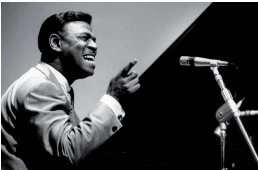
Earl Hines, en pianogigant som beundrade en annan.

dancing, and his mouth became open - - - it tore him up. He couldn't figure out how we got that sound."