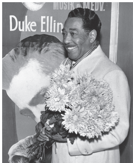
På Stockholmsbiografen Royal vid premiären på "Anatomy Of A Murder" , september 1959.