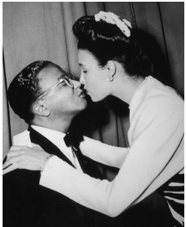
Vänskaplig kyss: Billy Strayhorn och Lena Horn.

Vid mitten av 1940-talet gifte sig Lena med den 9 år äldre Lennie Hayton, en pianist och arrangör som tidigare arbetat med Bix Beiderbecke, Red Nichols och Paul Whiteman. Detta blev till en början ett lyckligt äktenskap och tillsammans gjorde paret en hel del skivinspelningar med maken som arrangör och orkesterledare. Paret fick en fin hyllning i form av den inspelning som Count Basie gjorde av Quincy Jones' komposition "For Lena And Lennie" i slutet av 50-talet. Som ivrig förkämpe för de färgades rättigheter var Lena en viktig röst inom medborgarrättsrörelsen i USA, och hon deltog bl.a. i den bekanta marschen mot Washington.