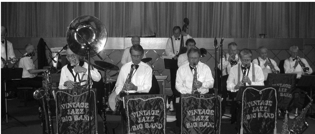
Vintage Jazzband var en av huvudattraktionerna på jazzfestivalen i Göteborg.