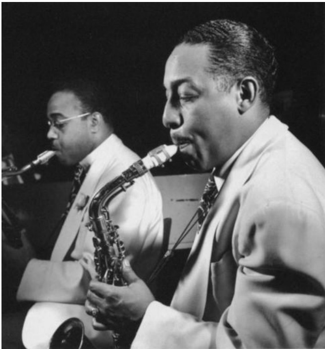
Johnny Hodges med Al Sears i bakgrunden. Troligen från mitten av 1940-talet.

recordings include the hard driving "Squatty Roo", Mercer Ellington's "Things Ain't What They Used To Be", the R&B chart hit "Goin' Out The Back Way" and the beautiful Billy Strayhorn compositions "Day Dream" and "Passion Flower".