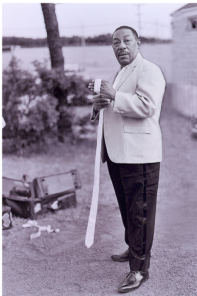
Johnny Hodges 1966 i Hyannis, Massachusetts.